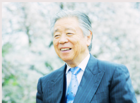
学校法人上田煌桜学園 さくら高等学校理事長